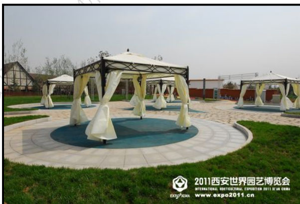
2011西安世界园艺博览会 INTERNATIONAL HORTICULTURAL EXPOSITION 2011 XI'AN CHINA www.expo2011.cn

展园介绍：希腊卡拉马塔展园旨在用现代科技表现希腊地中海地区的旅游观光、文化和建筑特色。展园分为五个部分，各有一个中心元素及一个画报横幅与屏幕录像，分别介绍希腊地区的整体印象、旅游、文化、建筑和特色美食。此外，通过运用特殊金属材质、视频、音频与特效灯光表现希腊现代化的一面，通过这样的视频与音频系统创造一场希腊文化信息的盛宴。