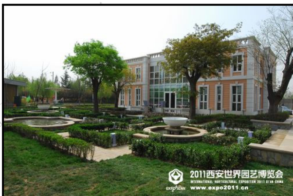
2011西安世界园艺博览会 INTERNATIONAL HORTICULTURAL EXPOSITION 2011 XI'AN CHINA www.expo2011.cn

展园介绍：巴黎以典型的欧洲风格为主线，由南向北贯穿全园。在景点的设置上，通过喷泉、花园、城堡的安排，完美的巴黎的欧洲风情。园区主题是被花园环绕的城堡，突显了欧洲城堡大气、庄严的感觉。通往城堡的小径、精心修剪的树木、整洁美观的喷泉，处处彰显时尚之都巴黎的风采。园区植物以灌木为主，大面积的花卉，草坪和灌木从，阳光照耀，是您度过高品位生活的好地方。