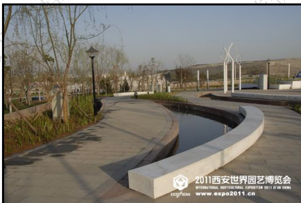
2011西安世界园艺博览会 INTERNATIONAL HORTICULTURAL EXPOSITION 2011 XI'AN CHINA www.expo2011.cn

展园介绍：阿富汗展园面积约为 1250 平方米，设计以草药园、塔什库尔干园、帕格曼园和玫瑰园为骨架，配以凉亭、鹅卵石路、伊斯塔利夫陶器、雕刻木门等等中亚典型庭院元素，充分表现了阿富汗古老的历史和丰富的民族特色。